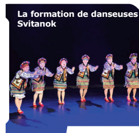
La formation de danseuses Svitanok