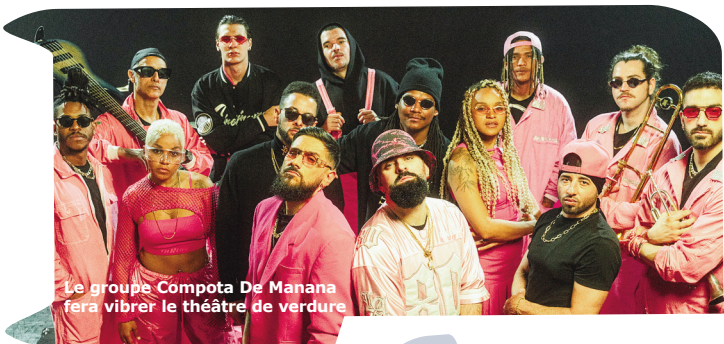
Le groupe Compota De Manana fera vibrer le théâtre de verdure