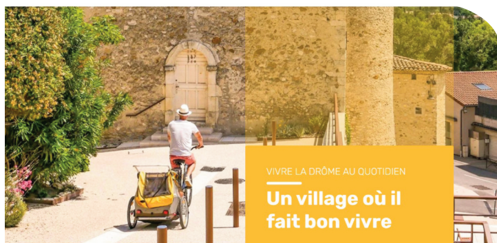
Un des visuels de la page d'accueil

La commune dispose désormais d'un nouveau site internet à la navigation fluide et agréable et aux infos régulièrement actualisées.